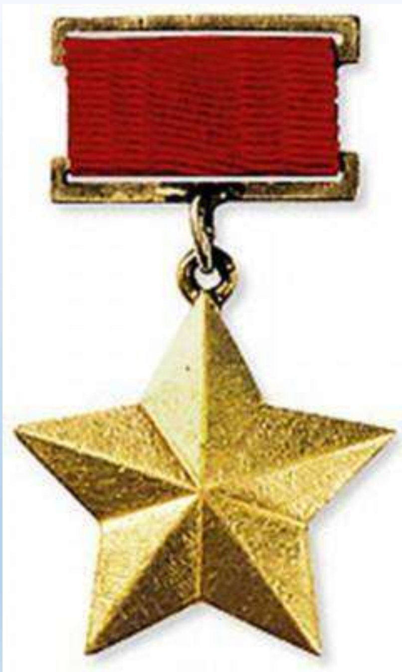
Медаль «Золотая звезда» город-герой Ленинград